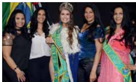
Miss Vitória e Luciana com, elas