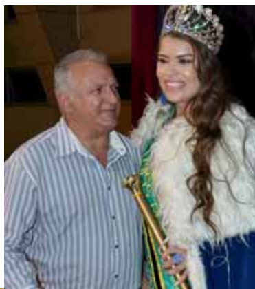
Miss Vitória e J Domingos sendo fotografado