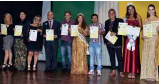
Coordenadores que marcaram presença no MISS BRAZIL MODEL® 2017.